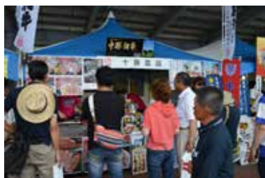
2014年の飲食ブースの様子