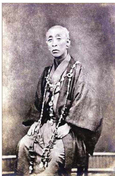
文化15年(1818)2月6日、紀州徳川家領の伊勢国一志郡須川村(現三重県松阪市)に郷士・松浦桂介の三男(第4子)として誕生。平成30年は「北海道命名150年」と「武四郎生誕200年」にあたる